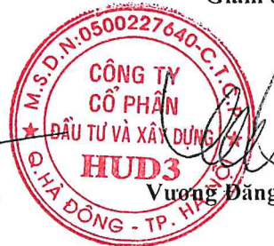
Vương Đăng Phương