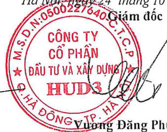
Vương Đăng Phương